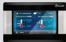
Контролер керування ECOMAX 860 Plum